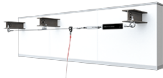
ABS-Lock SYS - au-dessus du niveau de la tête Lignes de vie franchissables ABS-Lock SYS II (8 mm) & IV (6 mm) installées au-dessus du niveau de la tête