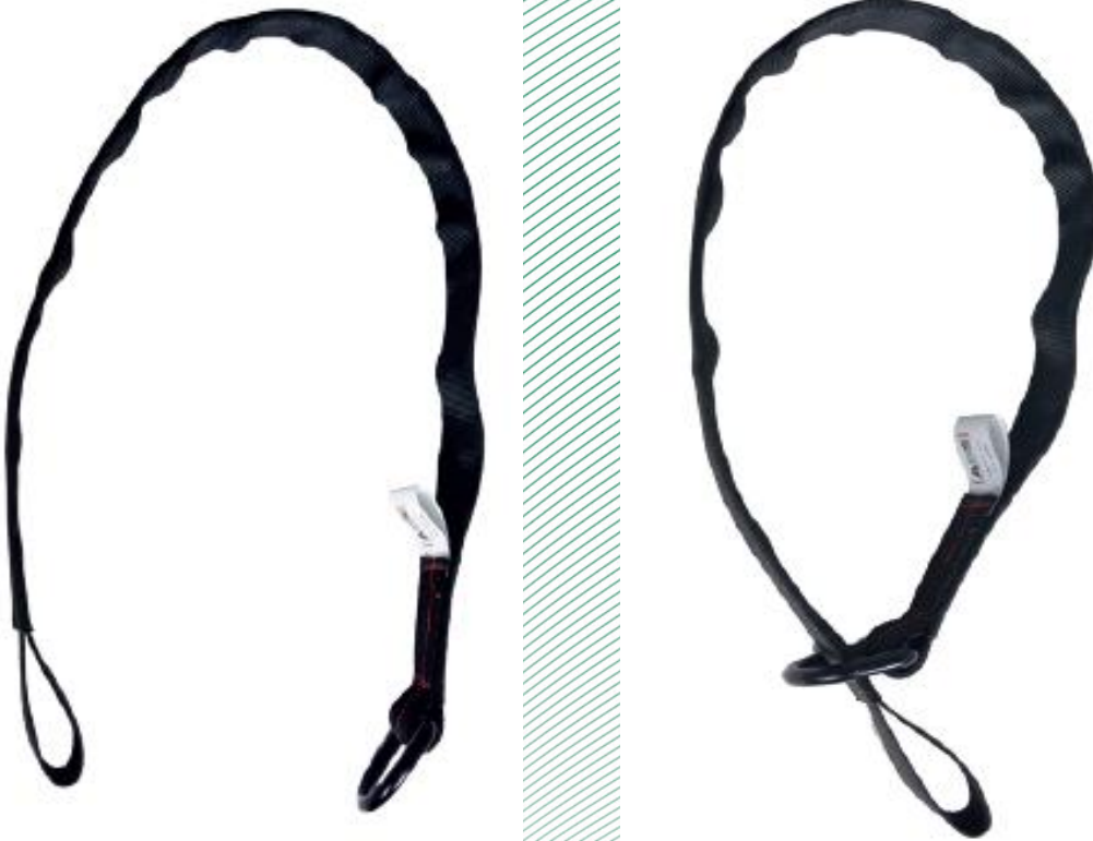
Figure 1: Dispositif d'ancrage, type: ABS Anchor Loop

Le montage peut s'effectuer au niveau d'un ancrage structural adapté présentant une solidité suffisante. La bande de tissu peut être directement reliée à l'ancrage structural à l'aide d'un élément de jonction approprié. En guise d'alternative, la boucle peut également être enroulée simplement autour de l'ancrage structural ou l'extrémité libre peut être enroulée autour de l'ancrage structural en passant par l'anneau en D (tête d'alouette). Au niveau de l'extrémité libre ou au niveau des deux extrémités, l'utilisateur peut, grâce à l'équipement de protection individuelle qu'il porte, se protéger contre le risque de chute.