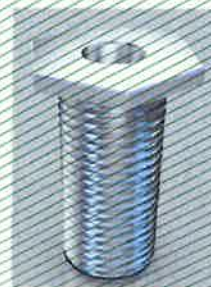
Figure 2 : Variante du manchon fileté