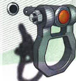
Fig. 3 : Exemple de montage pour dispositif d'ancrage, type : ABS Lock® I